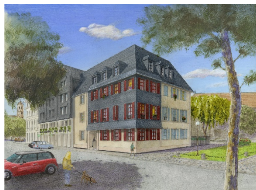
Programme – quai de la Tour