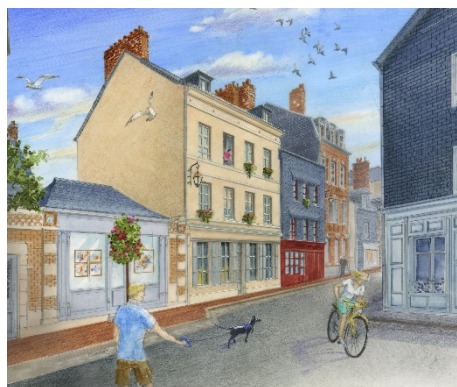
Programme – rue Notre Dame